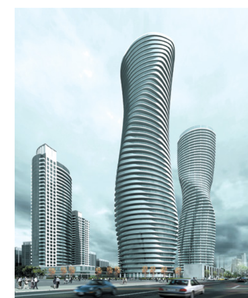
Absolute Towers Toronto Canada

Ainsi, la relation entre l'homme et la nature, ce langage universel chargé d'émotions, devient l'idée centrale, la source d'inspiration qui guide l'acte créatif du Studio d'architecture MAD depuis près de dix ans.