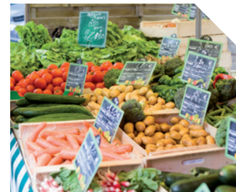
Un marché à quelques pas...