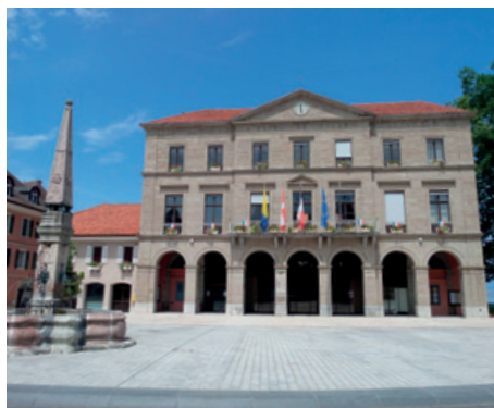
La mairie de Thonon-les-Bains

Posée, comme par enchantement, sur la rive gauche du sublime lac Léman , ayant pour décor de fond les majestueux sommets alpins, Thonon-les-Bains jouit d'un environnement naturel d'exception, pour ne pas dire unique. Ville thermale à la notoriété internationale, cette belle cité lacustre a pour réputation d'offrir une qualité de vie rare. Riche de son glorieux passé, la ville est aujourd'hui résolument tournée vers l'avenir. Projets urbains, dynamisme économique (elle intègre l'Arc lémanique), bouillonnement culturel et animations sportives soulignent ses ambitions.