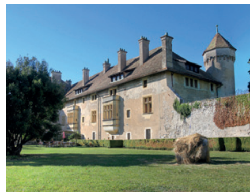
Le château de Ripaille