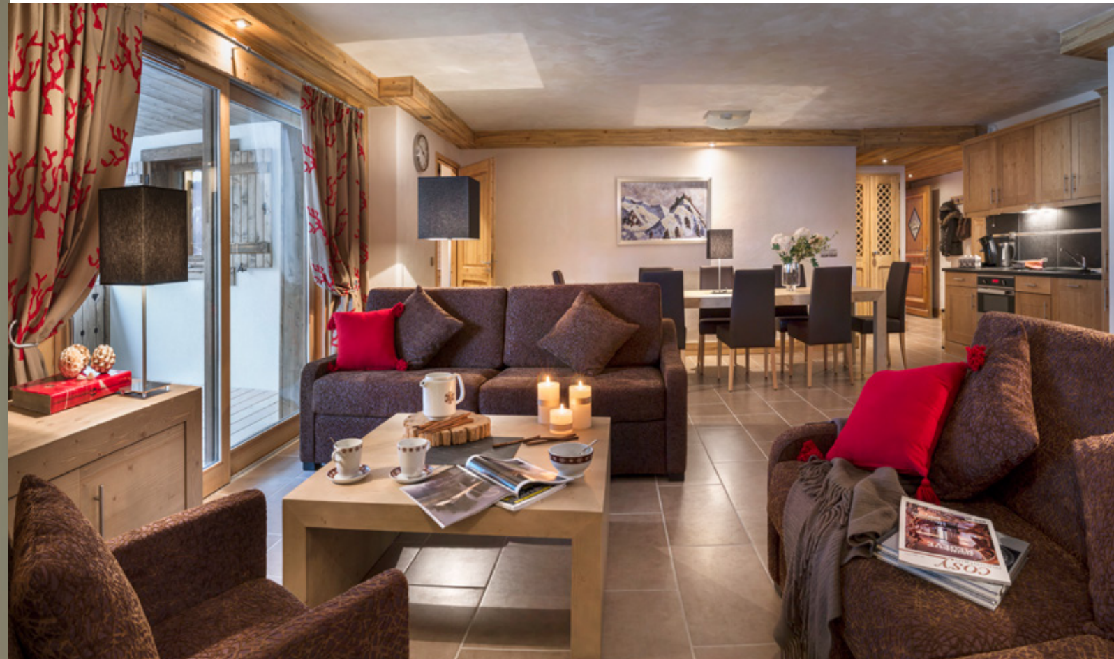
Ambiance d'appartement "Les Chalets d'Angèle" à Châtel An apartment at 'Les Chalets d'Angèle' in Châtel