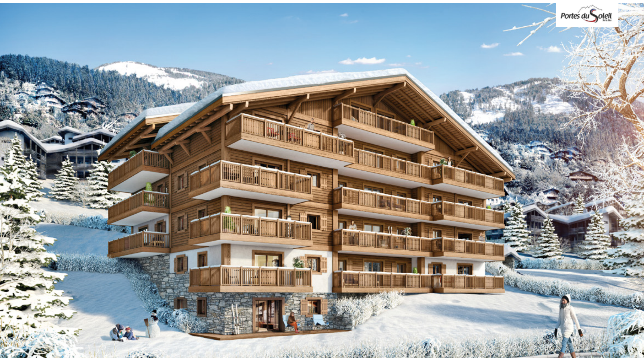
Perspective de projet, nouveau chalet "Les Chalets d'Angèle" Artist's impression for new phase at Les Chalets d' Angèle