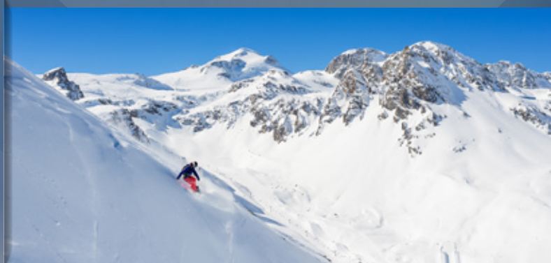
Panorama domaine skiable "Espace Killy" Panorama of the Espace 'Killy ski area'