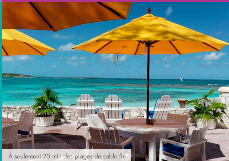
À seulement 20 min des plages de sable fin