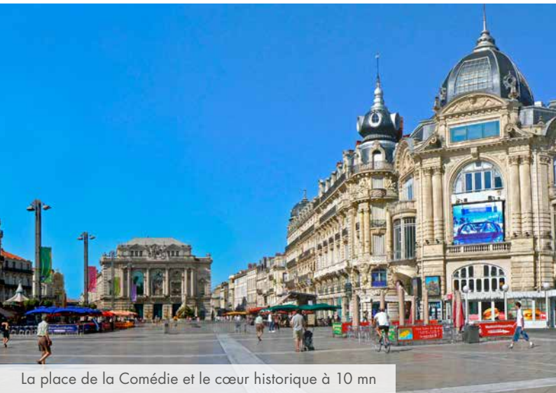
La place de la Comédie et le cœur historique à 10 mn

Au cœur de la nouvelle Occitanie, la métropole Montpelliéraine tient une place stratégique sur la méditerranée entre Marseille et Barcelone. Fière de son passé millénaire, la ville dispose d'un patrimoine de renom dans lequel s'intègre parfaitement les nouveaux projets de développement urbain. Bienvenue à Montpellier où l'ambition n'a pas de limite et l'art de vivre est sans concession.