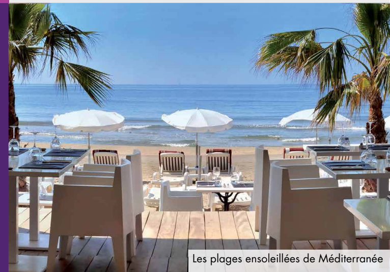
Les plages ensoleillées de Méditerranée