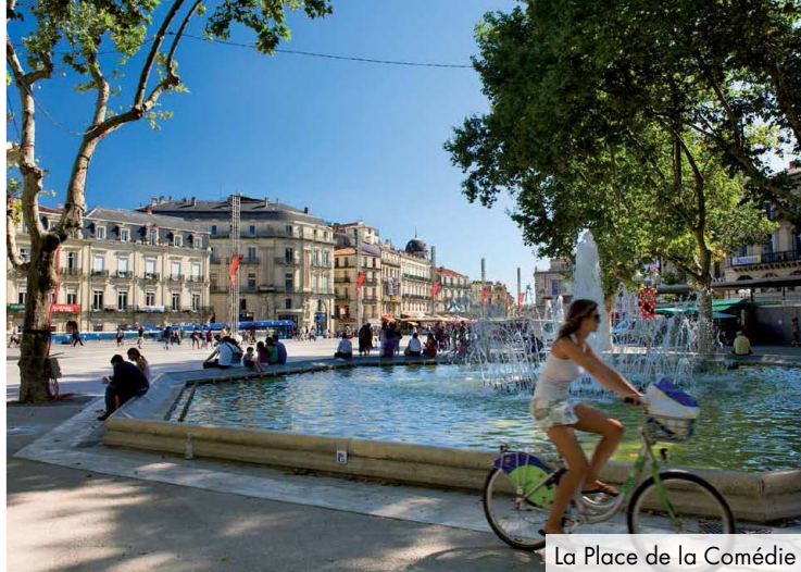
La Place de la Comédie

À 5 minutes du cœur historique de Montpellier, c'est une vie plus enrichissante avec tous les loisirs et commodités à votre porte qui vous attend : cinémas, musées, médiathèque, galeries commerciales et commerces, établissements scolaires... et où que vous soyez, il y a toujours un tramway qui passe !