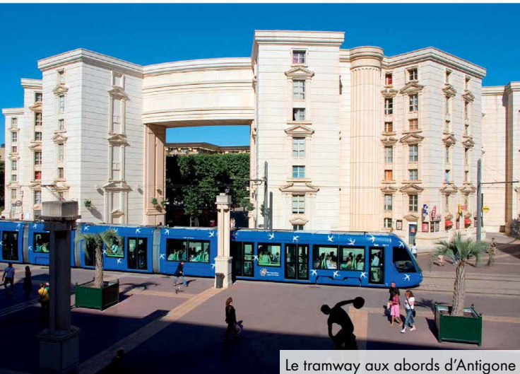
Le tramway aux abords d'Antigone