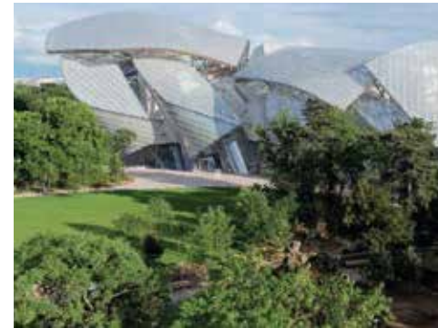
FONDATION LOUIS VUITTON À PARIS.