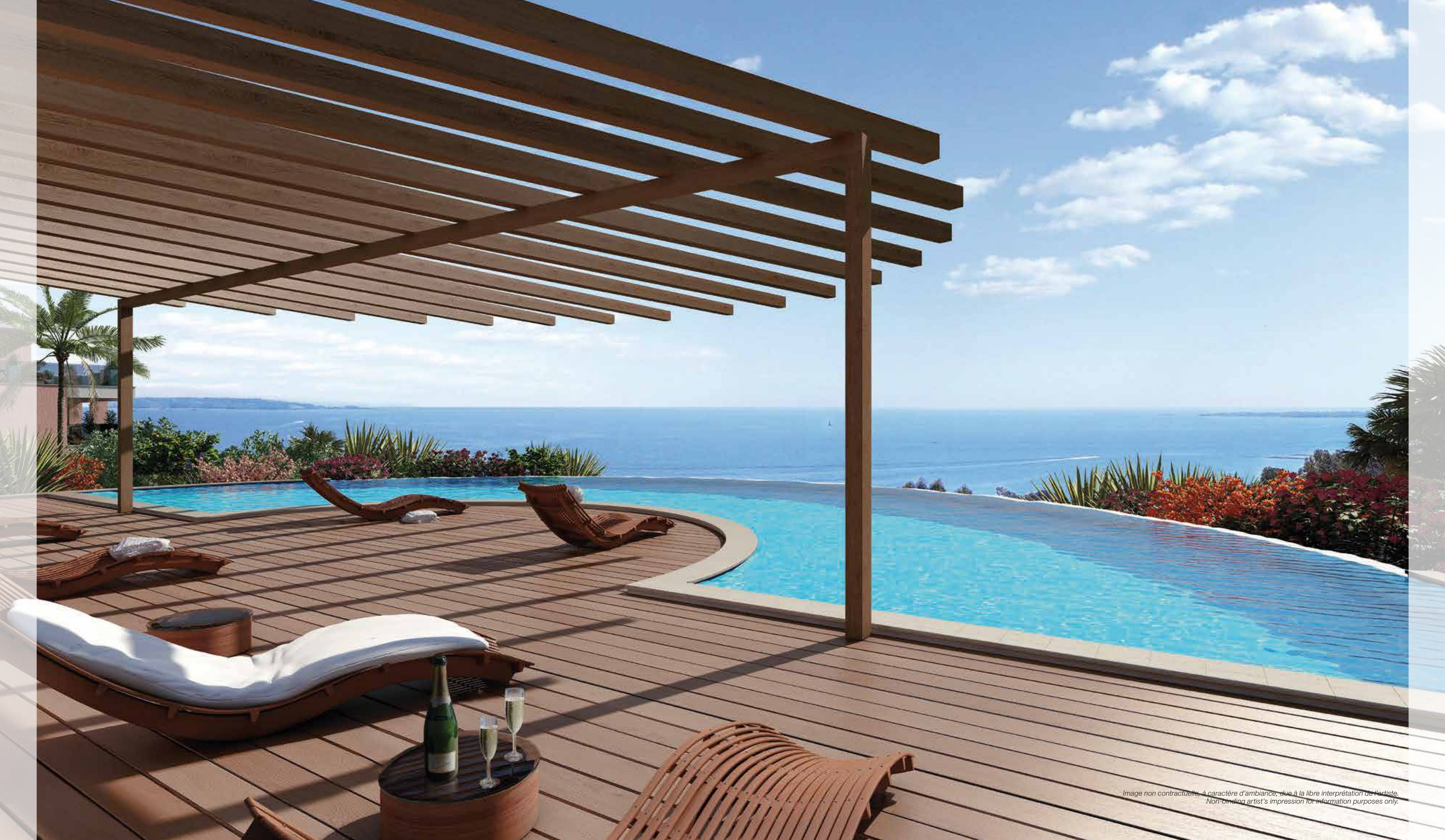
Image non contractuelle, à caractère d'ambiance, due à la libre interprétation de l'artiste. Non-binding artist's impression for information purposes only.