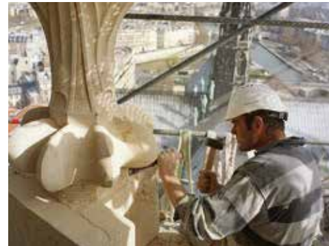
NOTRE-DAME DE PARIS.