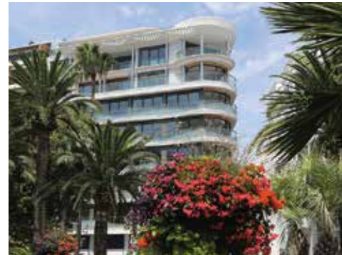
7 CROISSETTE CANNES. Appartements de grand luxe avec vue à couper le souffle sur la Méditerranée - Livraison 2014.