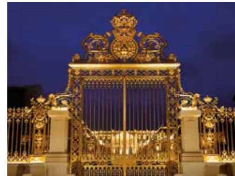
GRILLE ROYALE DU CHÂTEAU DE VERSAILLES. Mise en lumière de la Grille Royale.