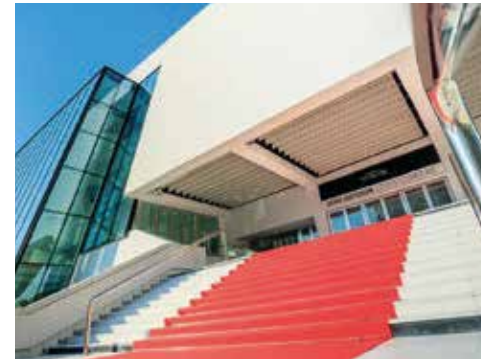
PALAIS DES FESTIVALS DE CANNES. Rénovation - Livraison 2020.