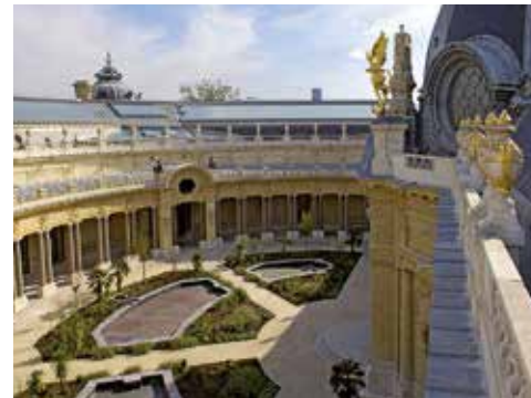
PETIT PALAIS. Modernisation et restauration du musée des Beaux-Arts. Création d'une infrastructure dans la cour centrale.