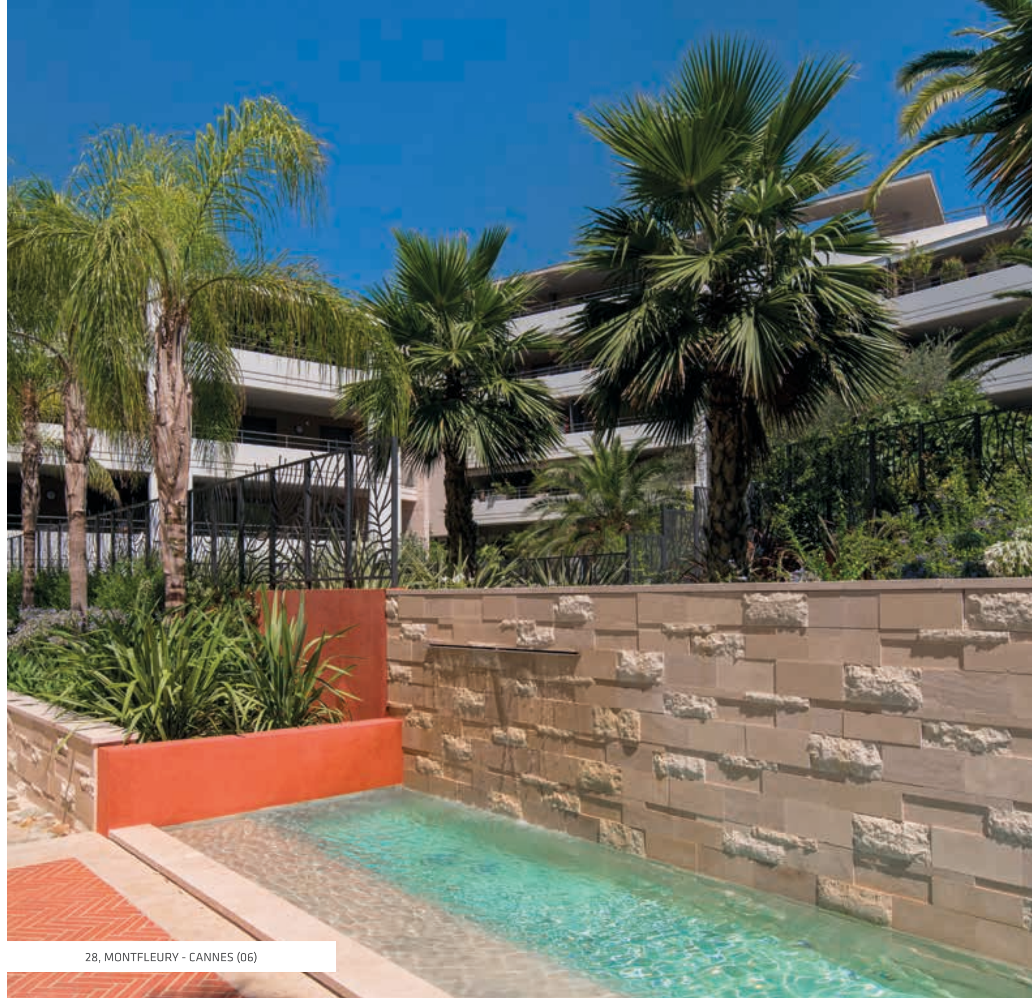
28, MONTFLEURY - CANNES (06)