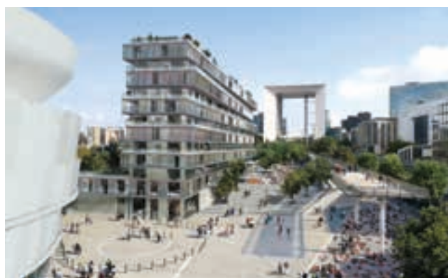
ONE - NANTERRE (92)