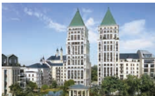
QUEST VILLAGE - PUTEAUX (92)