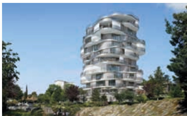
FOLIE DIVINE - MONTPELLIER (34)