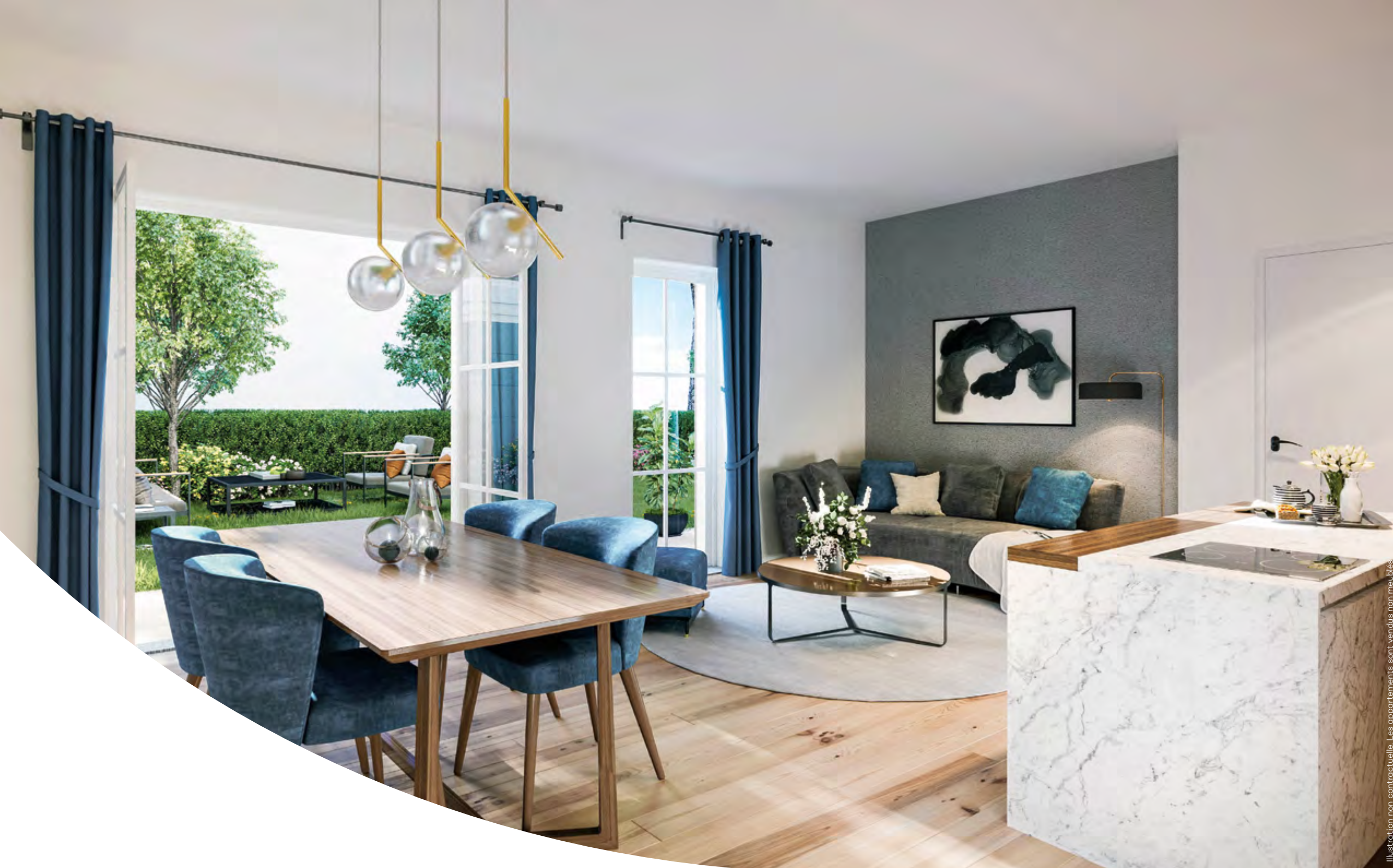
VILLA ARTHUR DARMEL : vue depuis un intérieur