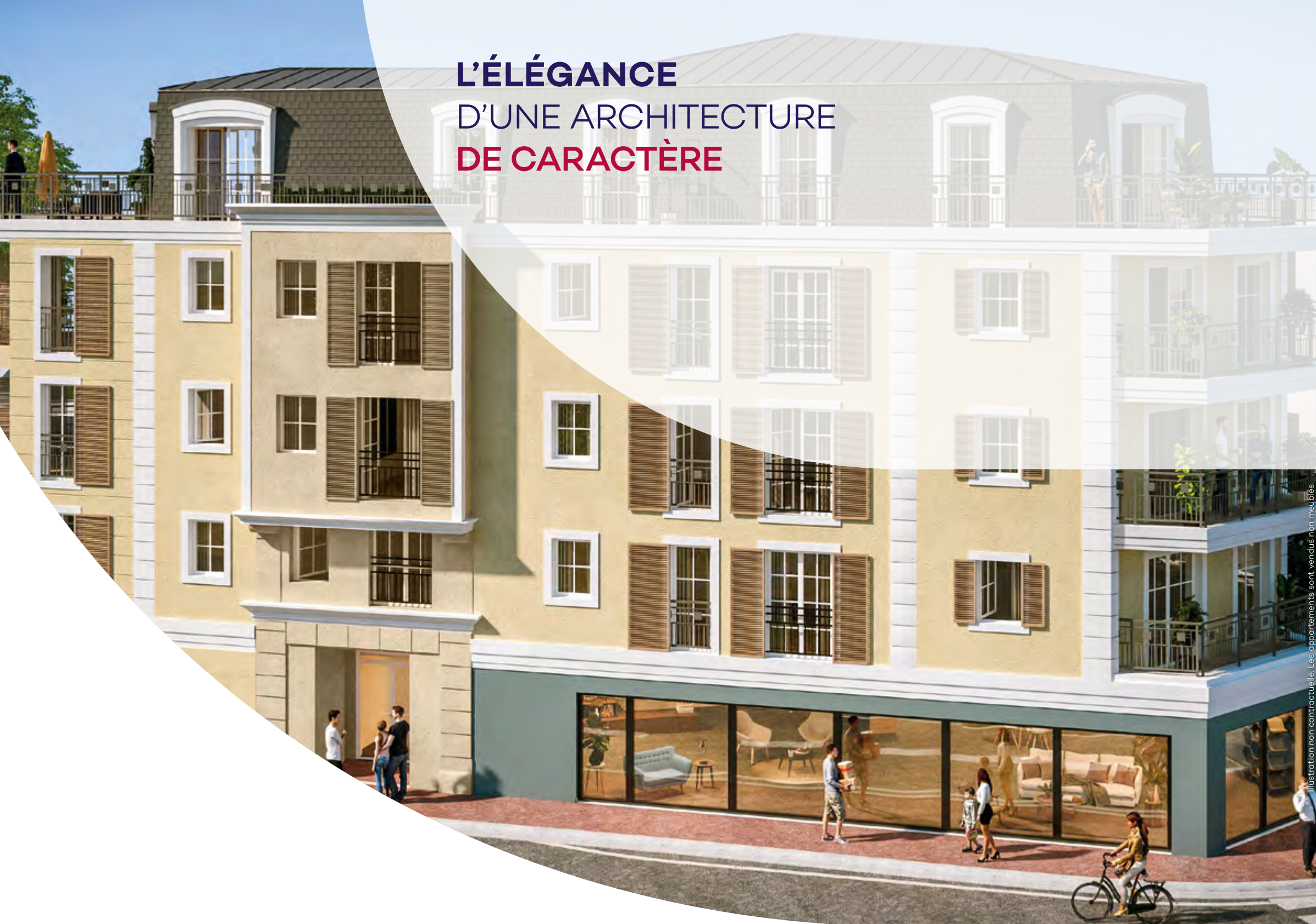
Illustration non contractuelle. Les appartements sont vendus non meublés.