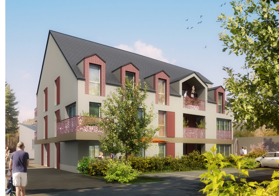
BAT. A ▲

Implanté dans un quartier calme et résidentiel, Le Génois forme un ensemble à taille humaine garantissant convivialité et tranquillité. Les appartements aux surfaces de vie confortables et fonctionnelles s'étendent jusqu'à 93 m 2 pour les plus grands d'entre eux.