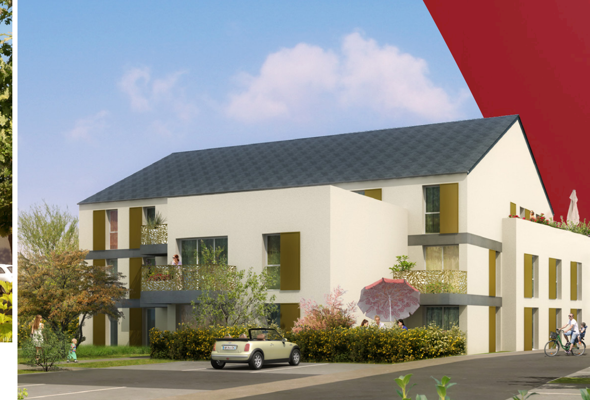
BAT. B ▶

Qu'il s'agisse d'un achat en résidence principale ou secondaire ou encore d'un investissement locatif, Le Génois propose différents types d'appartements, économes en énergie et bien pensés, qui sauront répondre aux attentes de chacun. Livrés clé en main, ces derniers vous assurent une installation en toute quiétude.