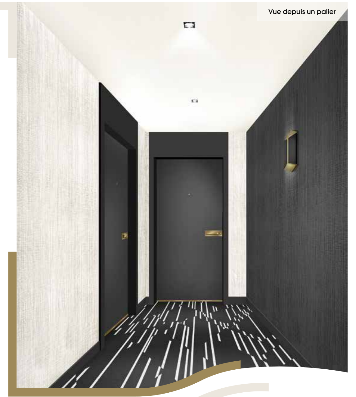
Vue depuis un palier