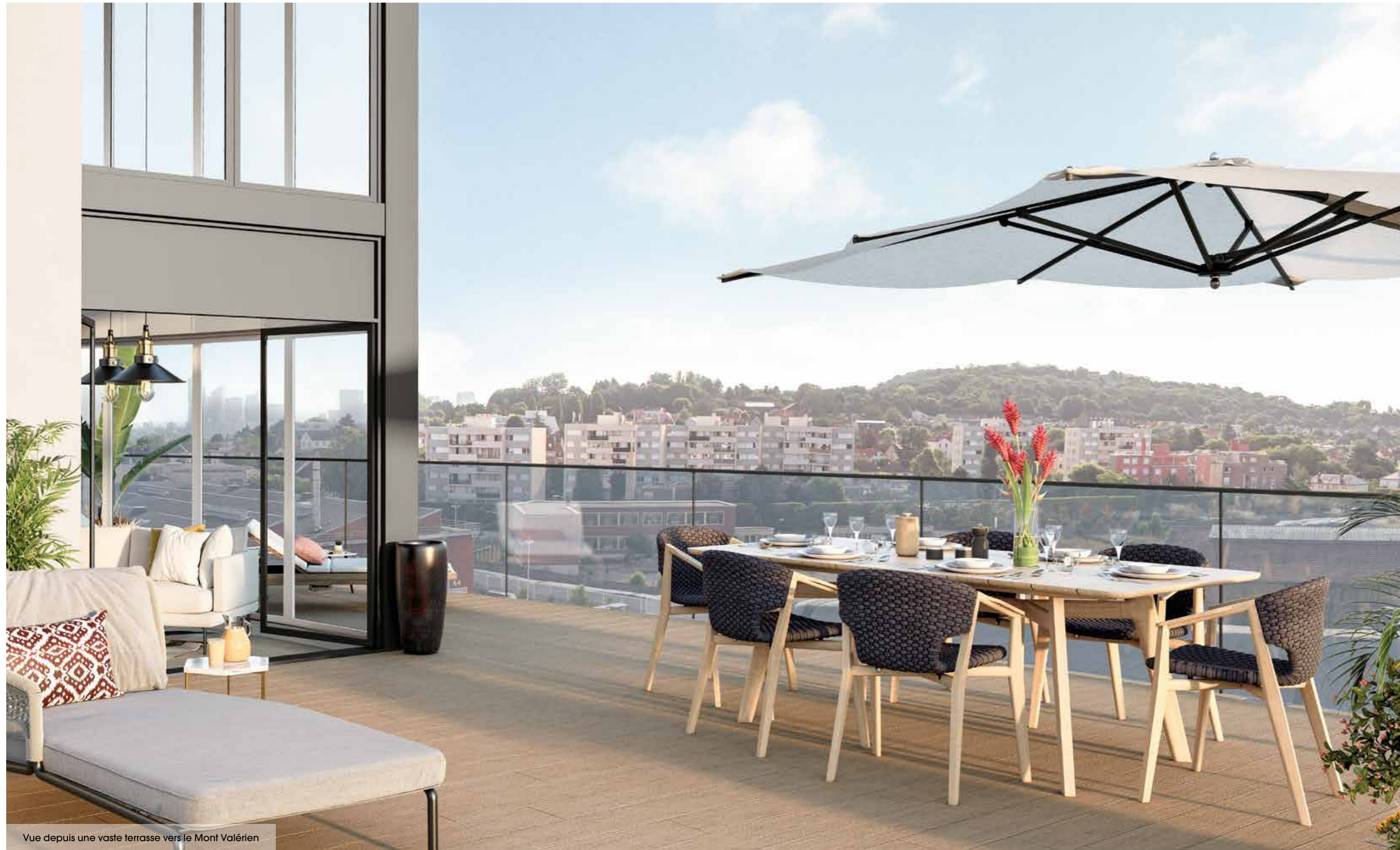
Vue depuis une vaste terrasse vers le Mont Valérien