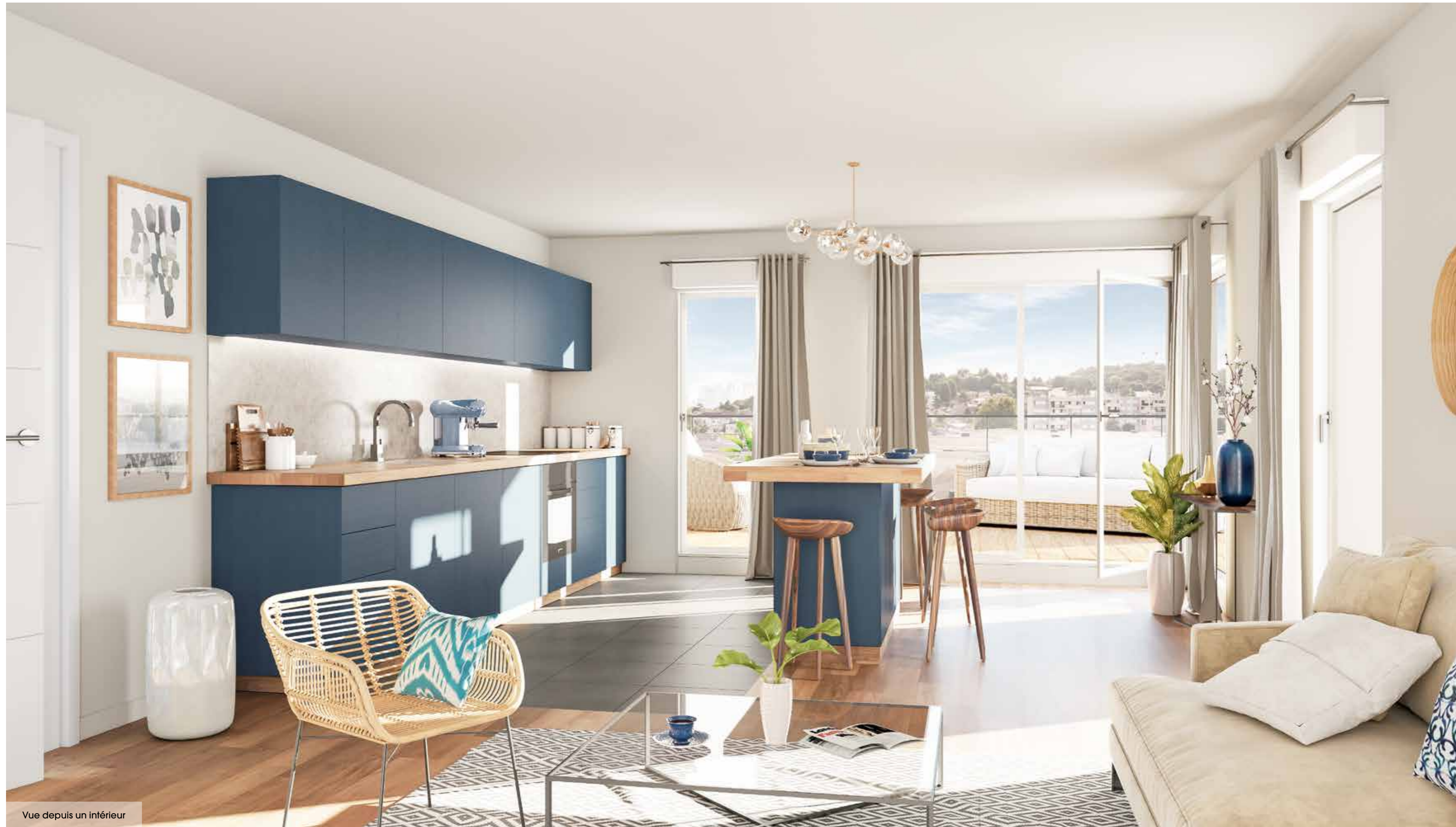
Vue depuis un intérieur