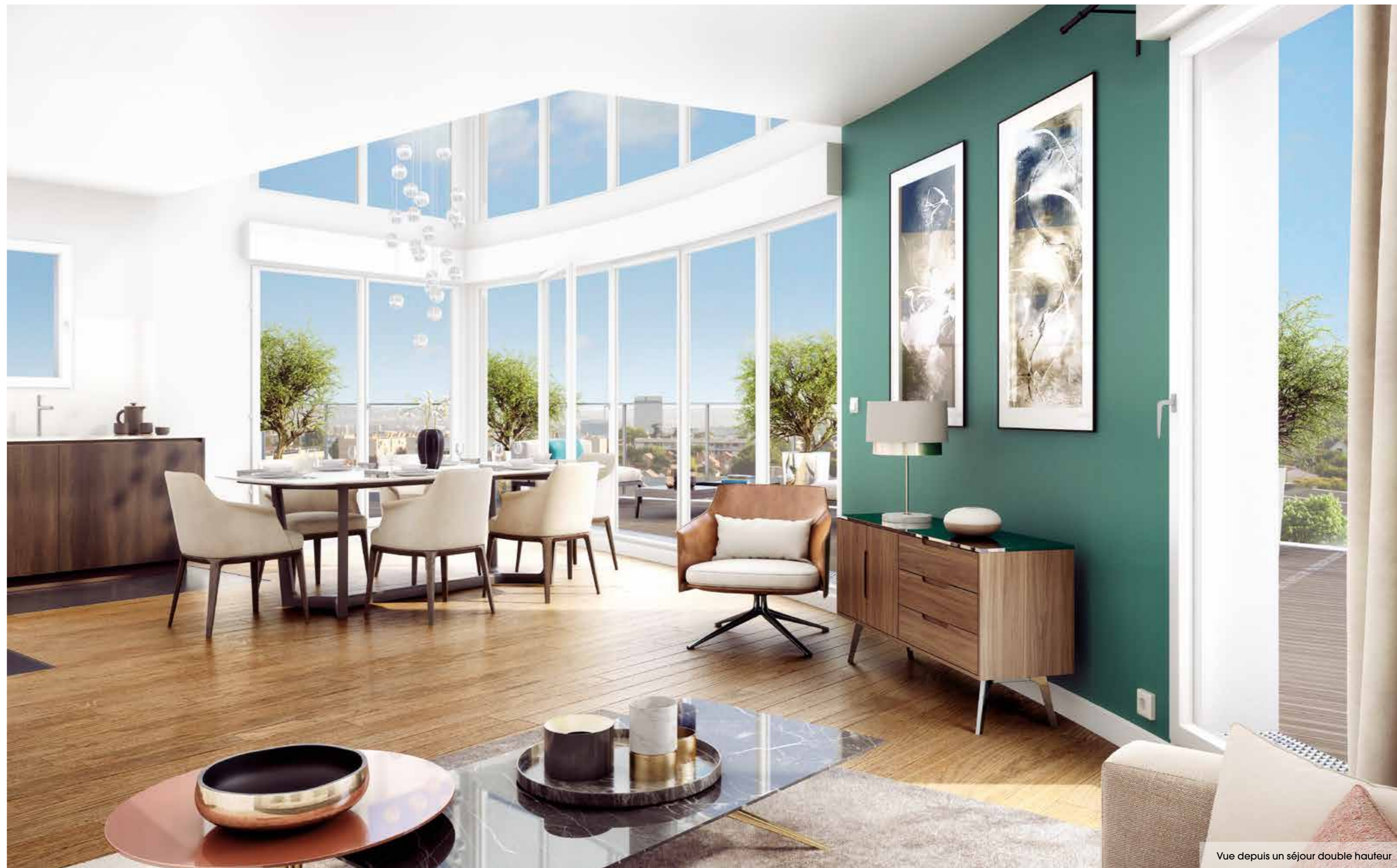
Vue depuis un séjour double hauteur

La conception architecturale propose de beaux espaces très lumineux. La disposition des appartements offre aux intérieurs les meilleures orientations. Pour certains, la double hauteur sous plafond apporte une réelle respiration, comme ici dans ce séjour cathédrale.