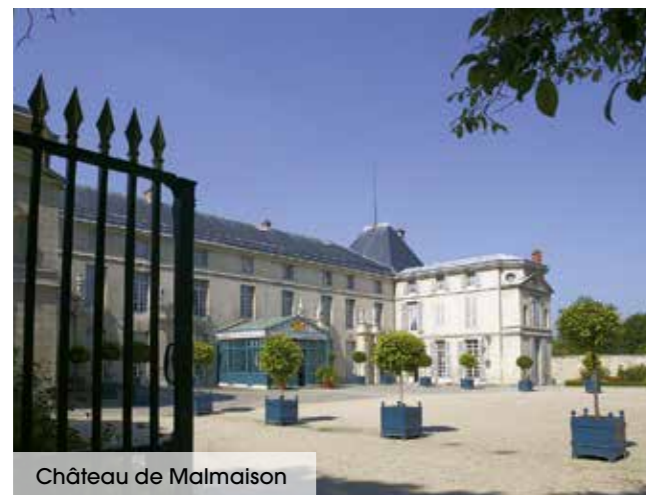
Château de Malmaison

À seulement 8 kilomètres de Paris, Rueil-Malmaison conjugue dynamisme et qualité pour un cadre de vie convivial. Demeures cossues de la Belle Époque, rues commerçantes aux enseignes de choix et marché traditionnel donnent à la ville un air de village où il fait bon vivre !