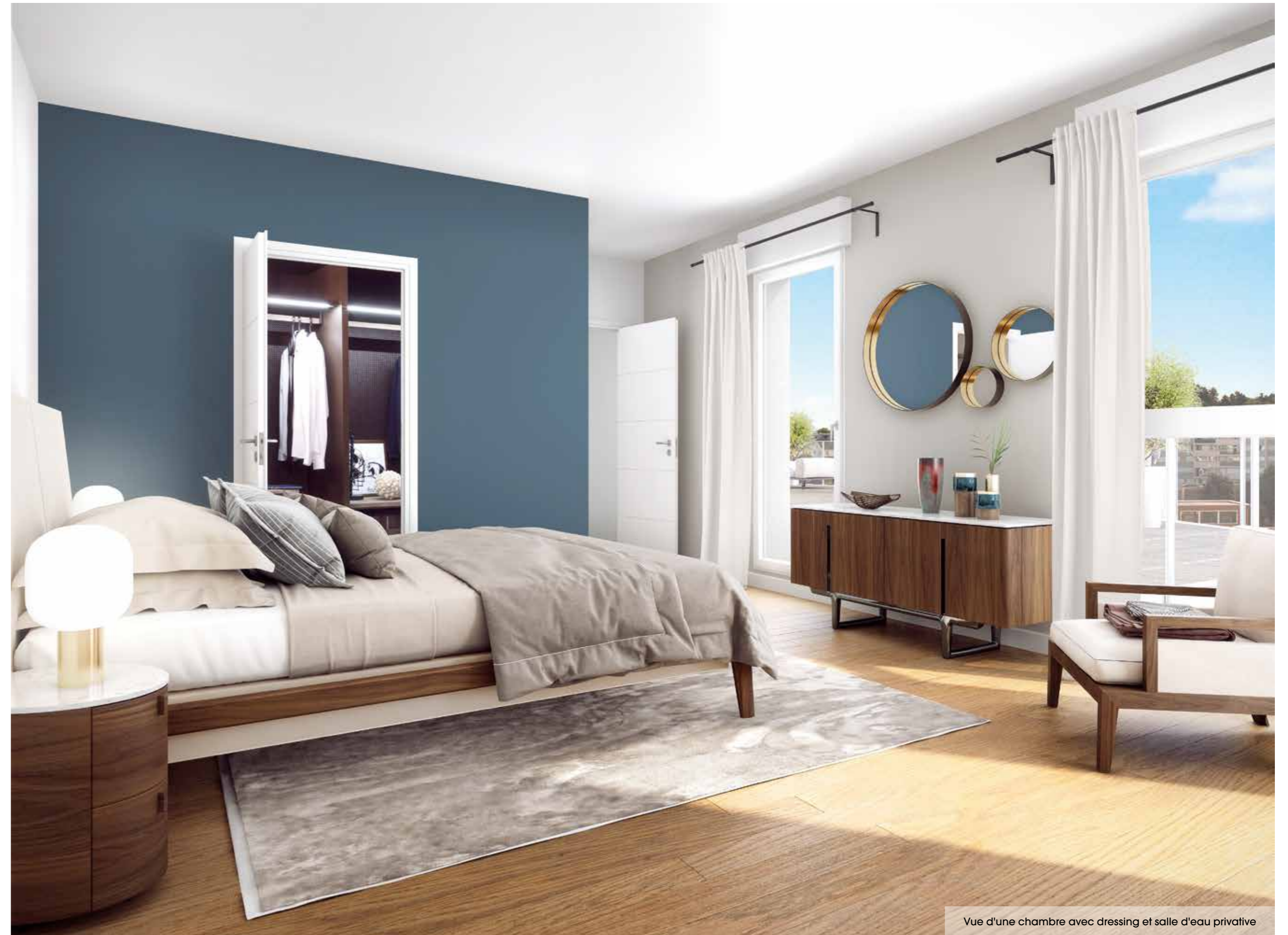
Vue d'une chambre avec dressing et salle d'eau privative