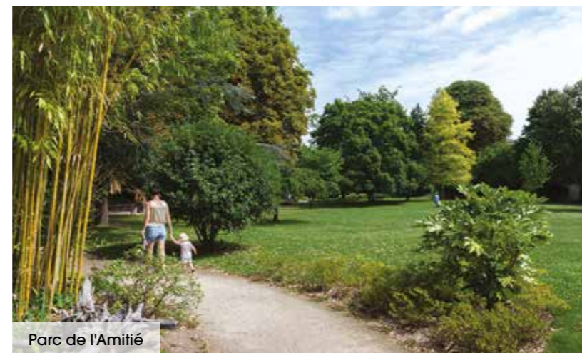
Parc de l'Amitié

Enfin, les établissements scolaires de qualité, de la maternelle au lycée, dont le réputé lycée privé La Salle-Passy Buzenval, participent à l'attractivité de la commune pour les familles.