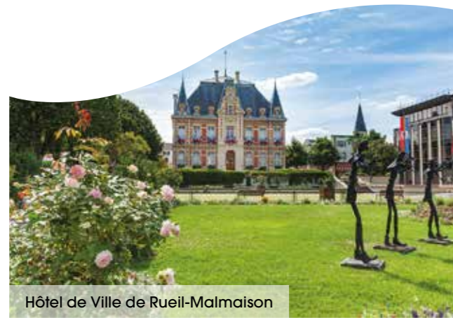
Hôtel de Ville de Rueil-Malmaison