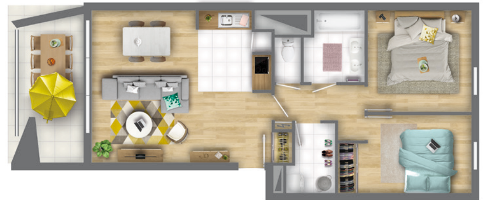
Exemple d'appartement 3 pièces Référence : N° 102 SURFACE HABITABLE : 66,99 m 2 LOGGIA : 8,96 m 2