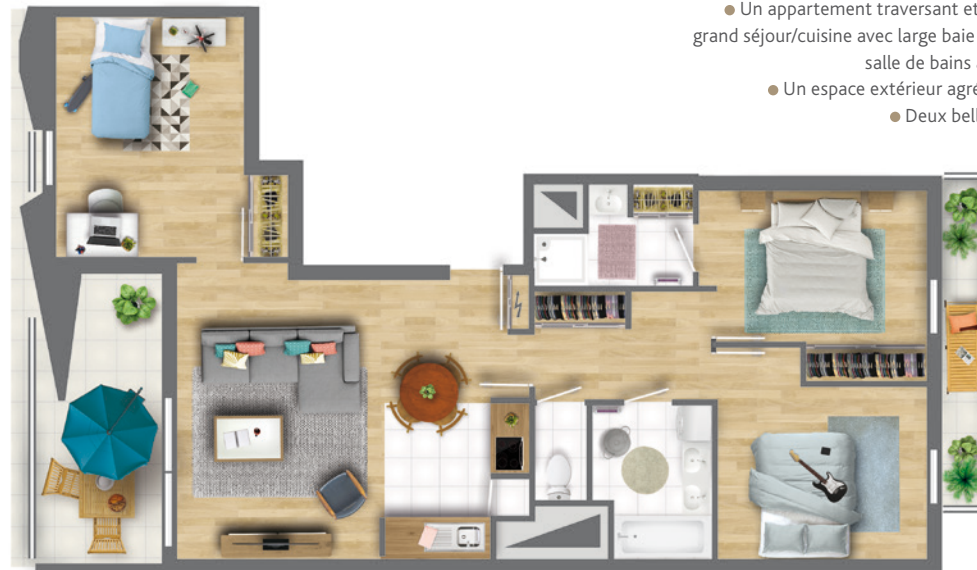
Exemple d'appartement 4 pièces Référence : N° 403 SURFACE HABITABLE : 79,82 m 2 LOGGIA : 8,96 m 2 TERRASSE : 4,41 m 2