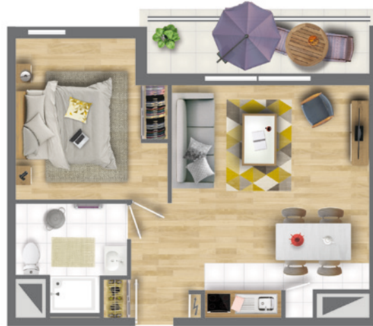
Exemple d'appartement 2 pièces Référence : N° 103 SURFACE HABITABLE : 46,73 m 2 TERRASSE : 6,83 m 2

Découvrez des appartements parfaitement interprétés où confort des aménagements, clarté et espaces extérieurs sont de mise. Au quotidien, bien-être et sérénité assurés !