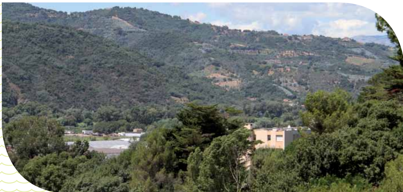
Massif du Tanneron vue depuis le site