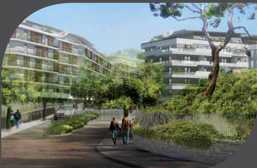
L'entrée de la résidence Green Domaine depuis l'avenue Michel Jourdan Architectes : Alain Derbesse architectes- Wilmotte & associés - Cabinet Paul Samak - Illustrateurs : Vacker et Lallour - Illustrations dues à la libre interprétation de l'artiste. Non contractuelles.

Pour que Green Domaine reste un havre de quiétude, un gardien gère au quotidien la résidence et les parties communes. Il reste à l'écoute des besoins et demandes de chacun.