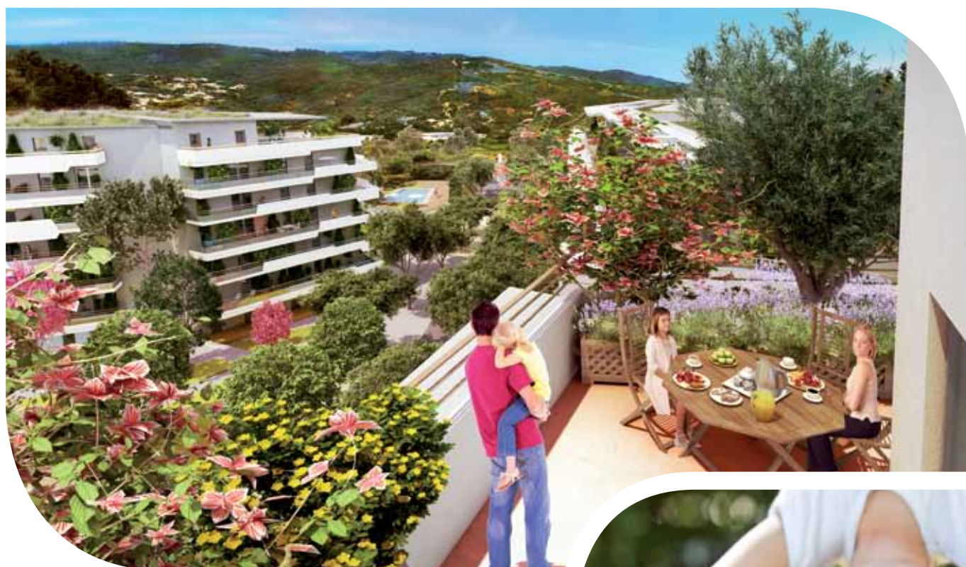
Vue d'un des balcons de la résidence Green Domaine Architectes : Alain Derbesse architectes- Wilmotte & associés - Cabinet Paul Samak - Illustrateurs : Vacker et Lallour - Illustration due à la libre interprétation de l'artiste. Non contractuelle. Terrasse vendue non meublée.