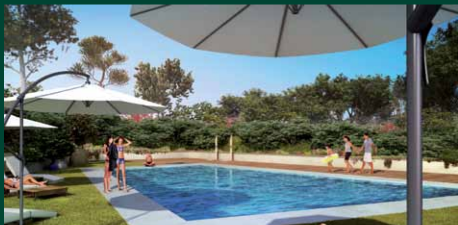
Piscine de la résidence Green Domaine

Les balcons filants, soulignés de blanc, se démarquent des tons gris des façades. Une touche de bois et de verre donne un caractère épuré à ces espaces de vie extérieurs.