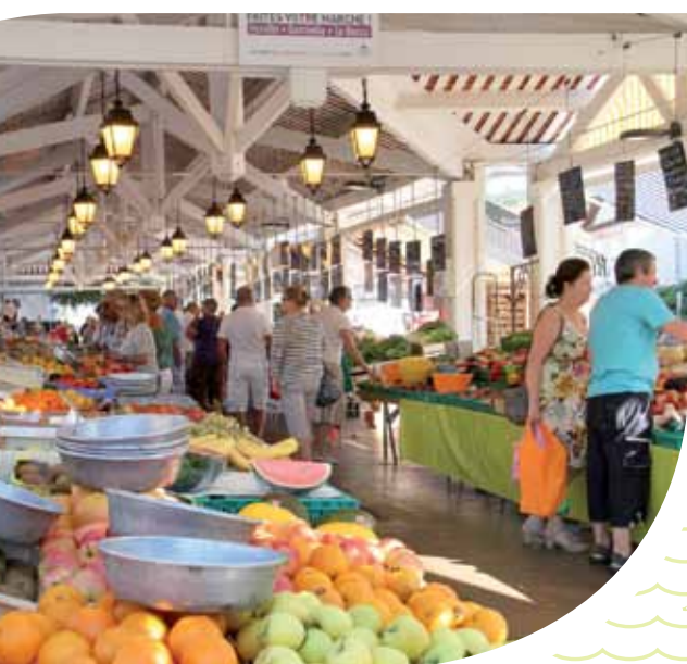
Le marché

La disposition du site forme un léger dénivelé ouvert sur la plaine de Laval et le massif du Tanneron. Venez donc vivre aux premières loges ! Découvrez sans tarder cette résidence d'exception nichée dans la nature, au calme, à seulement quelques kilomètres des plages.