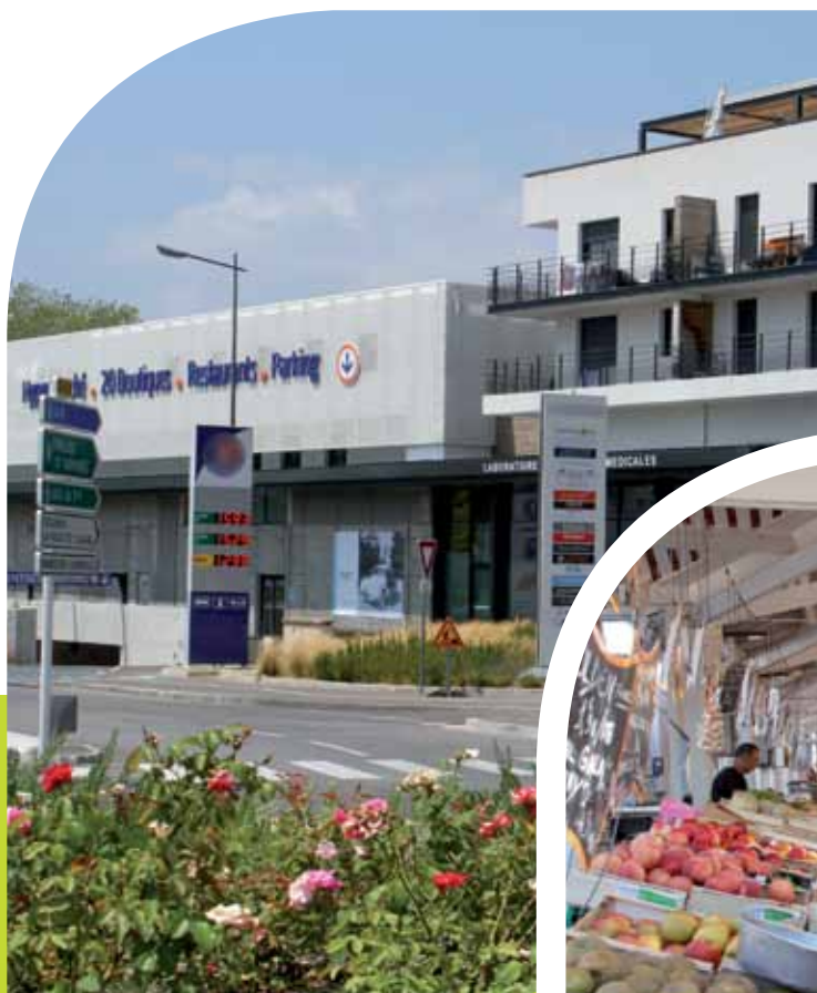
Le centre commercial

La nature occupe elle aussi une place privilégiée au sein de la ville. Les Cannois apprécient les squares et jardins municipaux mais aussi des sites exceptionnels et protégés comme le parc forestier de la Croix-des-Gardes ou les îles de Lérins.