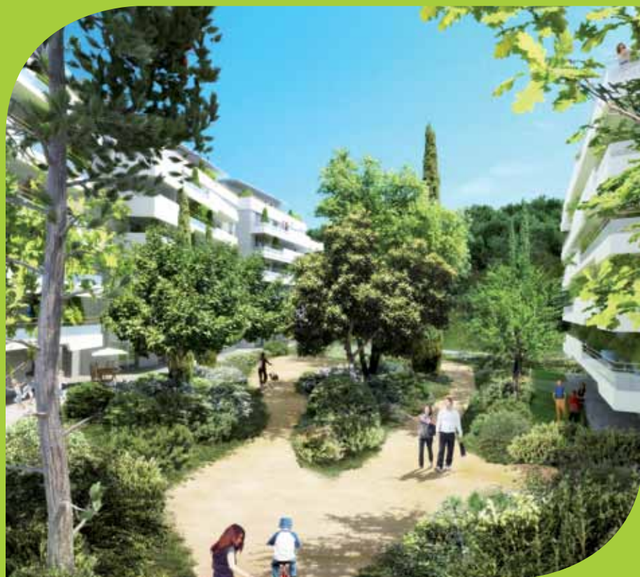
Vue de l'intérieur de la résidence Green Domaine

Adossé aux coteaux, le bâtiment adopte une écriture architecturale sobre aux dominantes blanches qui dialoguent avec les arbres des sous-bois et s'intègrent idéalement dans cet espace naturel.