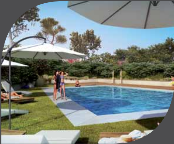
Piscine de la résidence Green Domaine