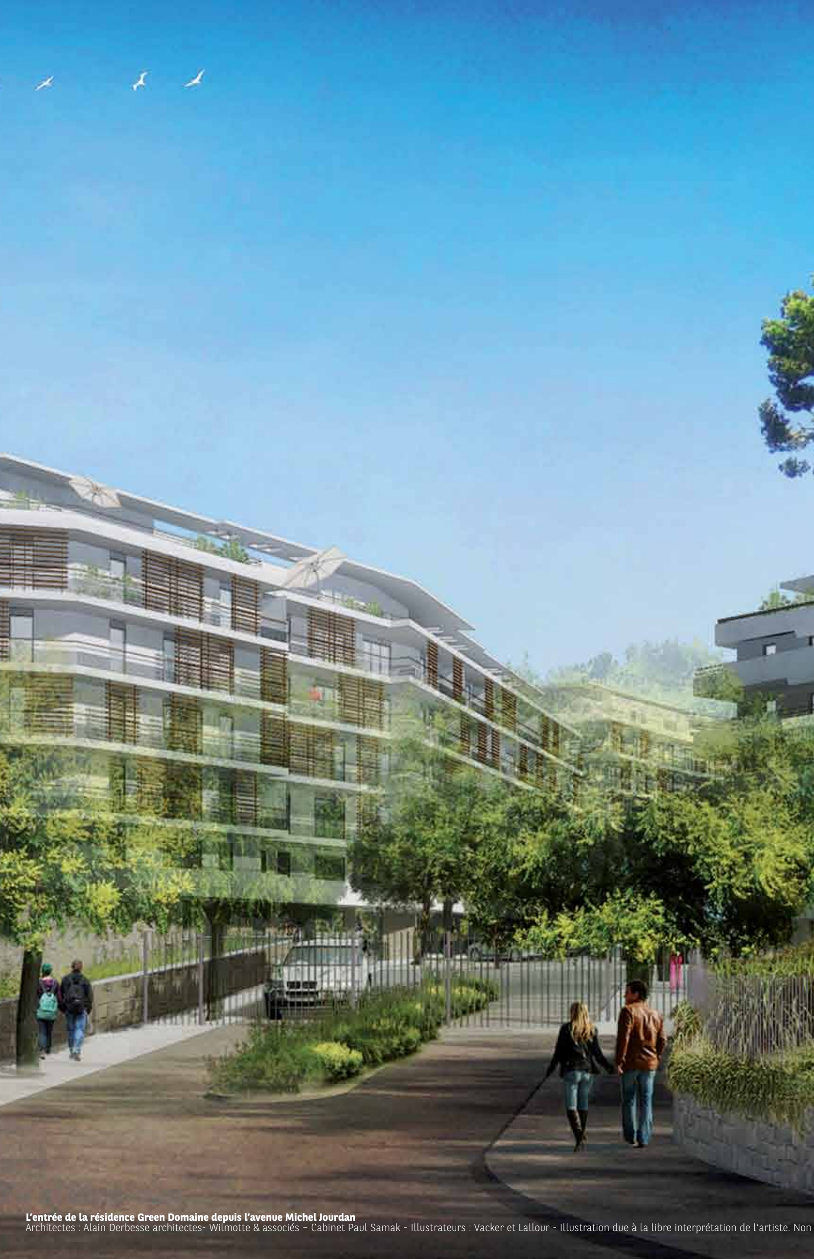
L'entrée de la résidence Green Domain depuis l'avenue Michel Jourdan

Architectes : Alain Derbesse architectes- Wilmotte & associés - Cabinet Paul Samak - Illustrateurs : Vacker et Lallour - Illustration due à la libre interprétation de l'artiste. Non