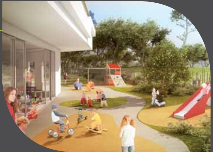
Crèche de la résidence Green Domaine

Idéalement intégrée au rez-de-chaussée d'un bâtiment, la crèche permet aux parents d'y déposer leurs enfants en toute sérénité durant la journée. Au calme et entourée de verdure, les plus petits s'y épanouissent et s'éveillent sereinement. Une cour extérieure close est également dédiée aux activités extérieures.